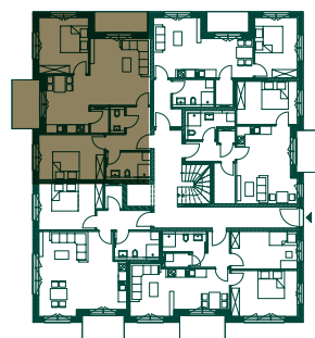
LAGE IM GESCHOSS