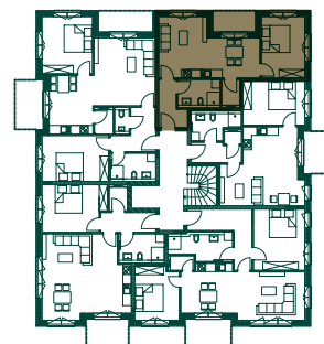
LAGE IM GESCHOSS