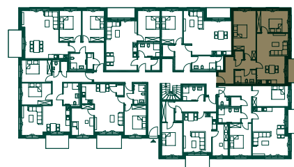
LAGE IM GESCHOSS