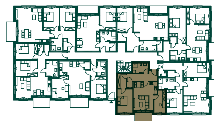
LAGE IM GESCHOSS