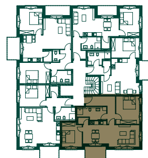
LAGE IM GESCHOSS