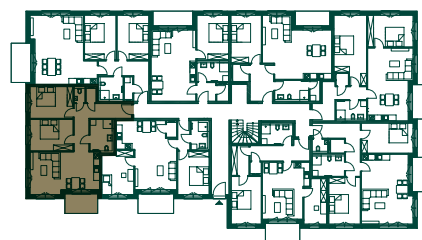
LAGE IM GESCHOSS